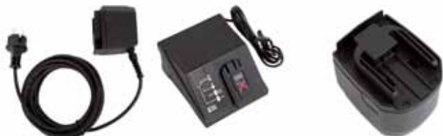
Adapter 230 V Novipro Compact