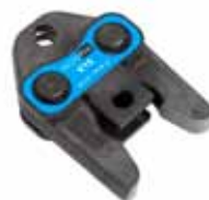
Pressback med M-profil