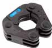
Presslinga med V-profil