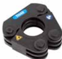
Presslinga med TH-profil