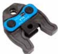
Pressback med M-profil