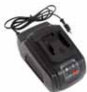
Laddare Novipro 3000 230 V