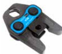
Pressback med V-profil