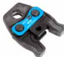
Pressback med V-profil