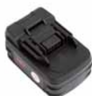
Batteri Novipro 3000 18 V/3 AH